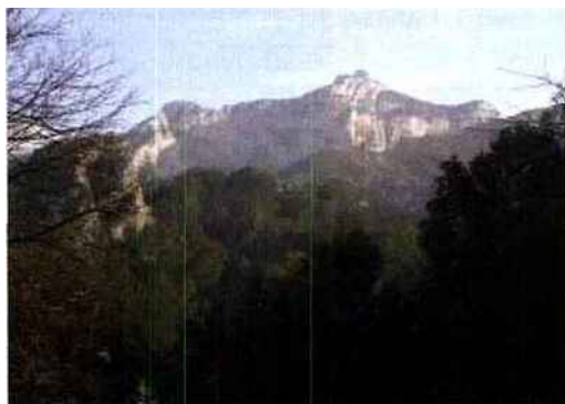
Vue du Gausnier dans les Alpilles

Pendant six semaines, l'art contemporain vous donne rendez-vous au cœur des Alpilles, en Provence. La deuxième édition du Festival Alpilles-Provence-Art - devenu le festival APART - offre en effet, du 7 juillet au 17 août, de nombreux parcours aux amateurs et passionnés, qui seront autant d'occasions de rencontres et de découvertes de ce qu'est la création actuelle.