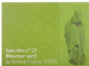
Sans titre n° 21 (Mourner vert) de Roland Flexner (1992).

TÉL. : 04 89 08 00 61 ET WWW.ARTCONTEMPORAINCOTEDAZUR.COM