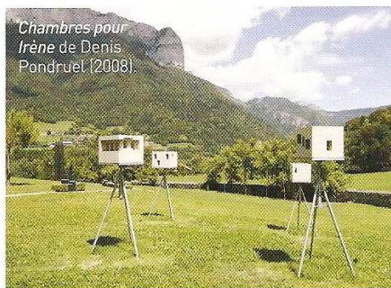
Chambres pour Irène de Denis Pondruet (2008).

191, ROUTE DU CHÂTEAU, 74290 ALEX TÉL. : 04 50 02 87 52