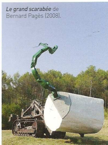
Le grand scarabée de Bernard Pagès (2008).